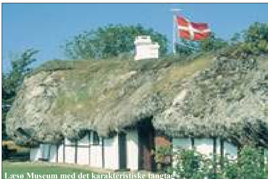
Læsø Museum med det karakteristiske tangtag