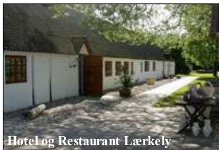
Hotel og Restaurant Lærkely

Omkring kl. 13 spiser vi middag på et udsøgt sted, restaurant Lærkely , hvor der også bliver tid til at strække benene i den store dejlige have, med masser af hygekroge og rekreative mil-