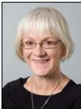
Arr. IM i Mårslet

Alligevel kan man midt i elendigheden, opleve en lille blafrende væge af håb. Fordi det står fast, at Gud har omsorg for den enkelte, sådan som vi læser det i Salme 8: "Hvad er et menneske at du, Gud, tager dig af det".